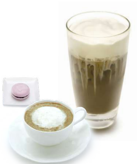
京ふわわ ほうじ茶 (アイス/ホット) お菓子つき 935円