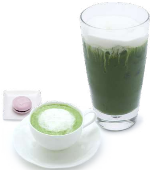
京ふわわ 抹茶 (アイス/ホット) お菓子つき 1,045円