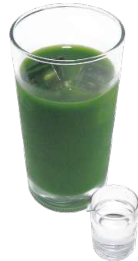
グリーンティー 990円